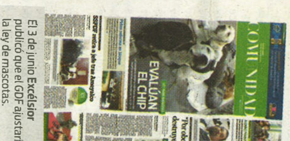
El 3 de junio Excelsior publicó que el GDF ajustaría la ley de mascotas.

“Se quiere fomentar y apoyar la actividad de los albergues y de las instancias que se